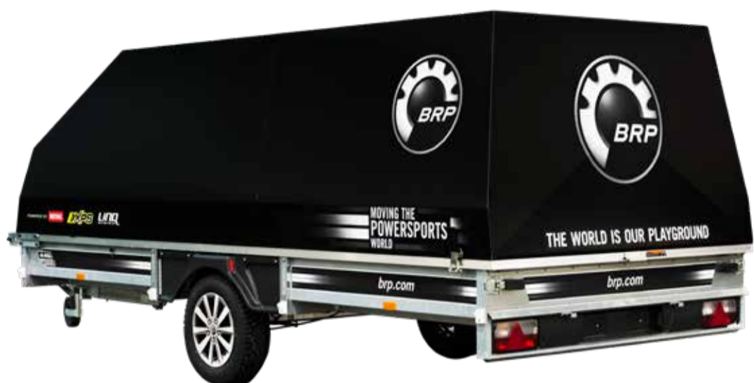
Touring 445TXI™ Vagnen på bilden är extrautrustad.