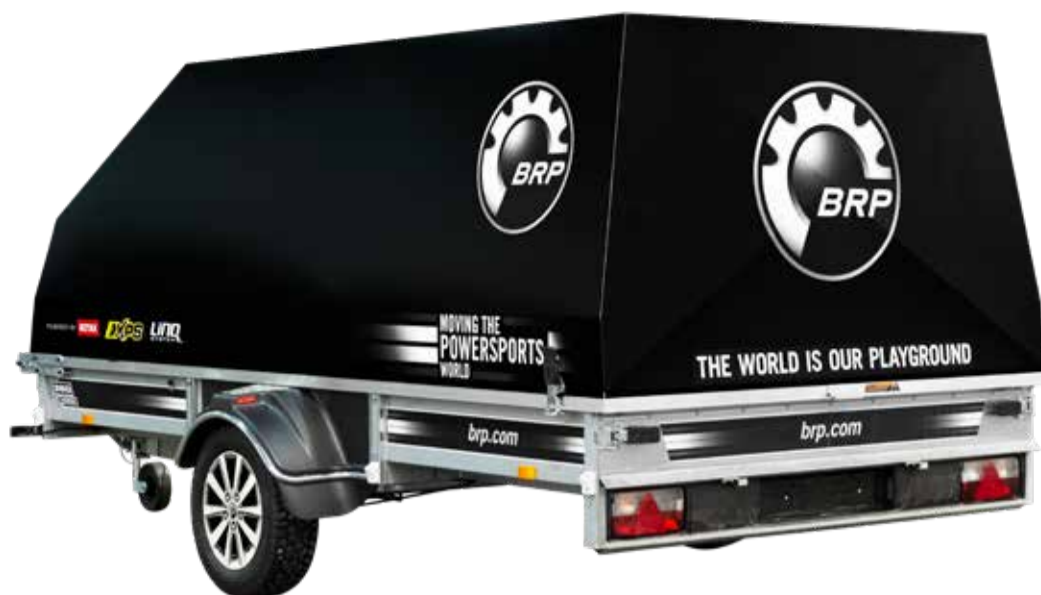
Touring 380TX™ Vagnen på bilden är extrautrustad.

Det ska vara enkelt att välja storlek på BRP släp. Våra släp kommer i fyra flakbredder; 135 cm, 150 cm, 185 cm och 220 cm samt sju flaklängder; 330 cm, 380 cm, 445 cm, 490 cm, 550 cm, 650 cm samt 750 cm. Behöver du bara lasta en skoter? Då är BRP Adventure rätt. För dig som vill lasta en skoter och packning rekommenderar vi BRP Racing. För dig som vill lasta 2 skotrar och packning passar Touringserien bäst. Vill du ha massvis med plats är det Expedition som enkelt lastar 2 skotrar, skotepulka & packning.